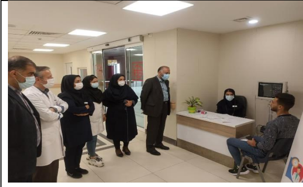
آموزش به همراهان بیمار در لابی بیمارستان توسط رابطین بیمارستانی سگنه مغزی