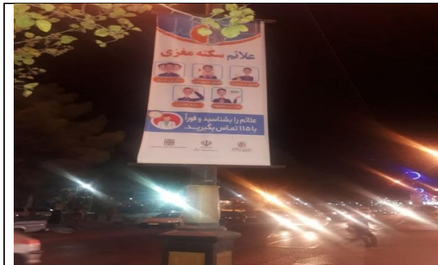
بنرهای آموزشی علائم هشداردهنده استروک (BEFAST) در میدان ها و بولوار های اصلی شهر