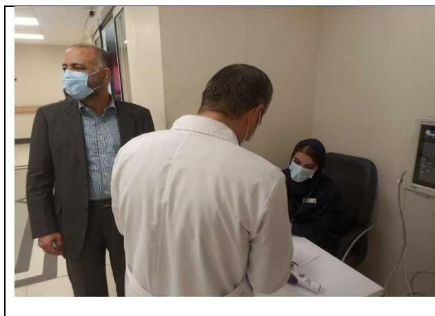
آموزش به همراهان بیمار در لابی بیمارستان توسط رابطین بیمارستانی سکتة قلبی