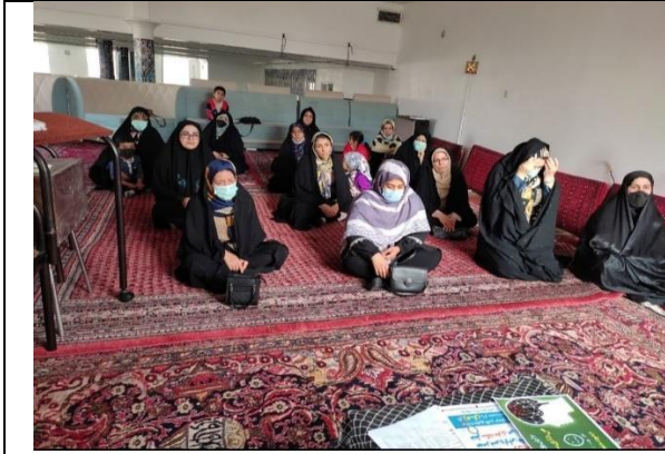
آموزش به مردم در مساجد توسط رابطین بیمارستانی سکته قلبی