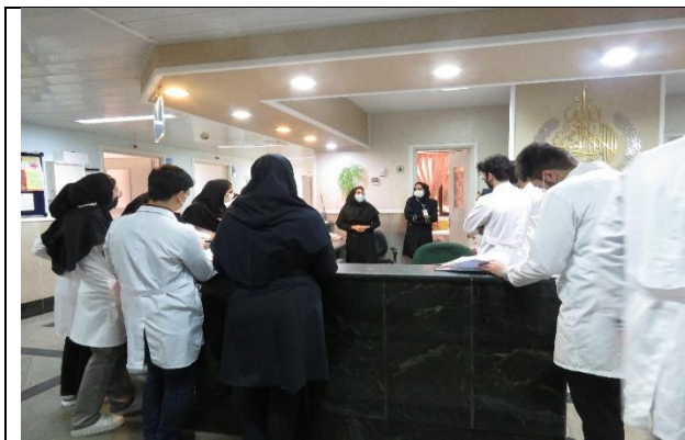
آموزش به دانشجویان پرستاری توسط رابطین بیمارستانی سکته قلبی