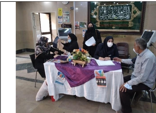
آموزش به همراهان بیمار در لابی بیمارستان توسط رابطین بیمارستانی سکتة مغزی