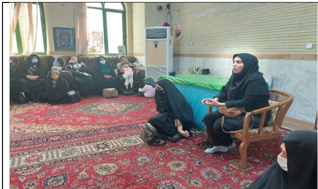
آموزش پیشگیری از استروک در بازه زمانی 10 روزه در مساجد بزرگ شهر و پایگاه های بسیج