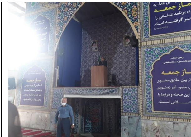
سخنرانی ریاست محترم دانشگاه در نماز جمعه به مناسبت هفته استروک

✓ ارائه مطالب آموزشی به بیماران و همراهان بیماران در تمامی بیمارستان های تابعه و تحت پوشش دانشگاه توسط رابطین محترم بیمارستانی سکتة مغزی با برپایی میز سلامت ارائه گردید .