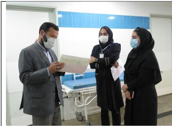
آموزش به همراهان بیمار توسط رابطین بیمارستانی سکته قلبی